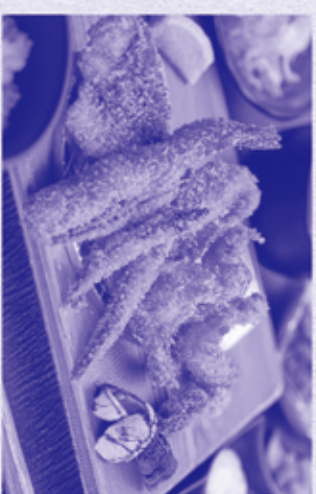
7. 海鮮フライ御膳 エビ・カニ・魚・お肉のなどいろいろな海の幸 をサクッと香ばしく揚げました。