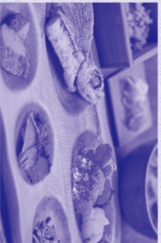
3. 潮風佐賀御膳 海の幸・山の幸を炊き込んだご飯です。 飛魚の唐揚げ・屋久島揚げ地魚のお刺身・ 小鉢・お味噌汁・香物が付きます。