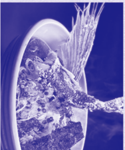
12. 飛魚ラーメン ラーメン・精進汁