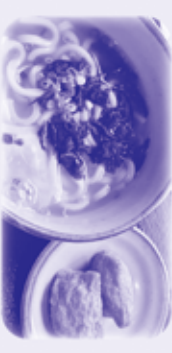
月見うどんとおいなりさん