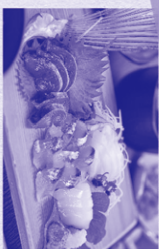
6. 旬の刺身盛り御膳 3種類以上のお刺身の盛合せです。 その日の水揚げによって魚は異なります。