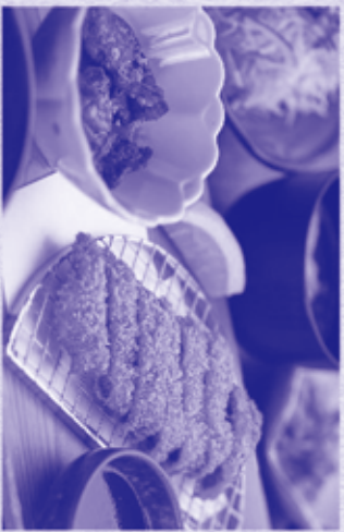
1. 屋久島もみじ御膳 (鮫肉料理) 船の新しい上品な鮫肉をマツと独自のタレで 焼いた焼肉二つの味をお楽しみ頂きます。