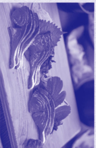
5. 首折れ鮎のお刺身御膳 鮮度を保つ為に漁獲後すぐに首を折って 血抜きをしたササギを新鮮なままお刺身に。