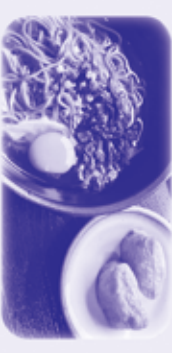
月見そばとおいなりさん