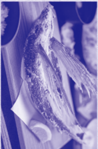
2. 飛魚の唐揚げ御膳 オリーブ油で一夜干しし、余分な水分を省いて 旨味を増した飛魚を揚げて、一匹まるごと 唐揚げにしました。羽先も是非一度ご賞味下さい。