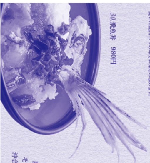
30. 飛魚弁 980円